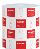
460263 Katrin System Handtorkrulle M 2-Lagers, Blå