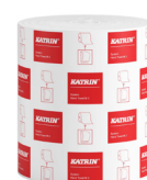
58198 Katrin System Handtorkrulle M 2-Lagers