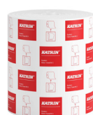
460102 Katrin Torkrulle M till Dispenser System 2-Lagers