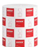
460232 Katrin Torkrulle L till Dispenser System 2-Lagers

Relaterade produkter från totala sortimentet. Det lokala sortimentet finner ni på vår webbplats.