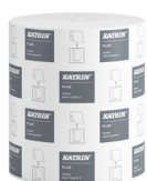
82537 Katrin Plus Dispenser Paper Towel Roll System