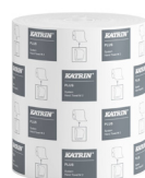
460058 Katrin Plus Torkrulle M till Dispenser System 445 Ark 2-Lagers