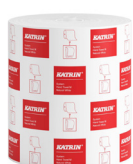
460201 Katrin Torkrulle M till Dispenser System 1-Lagers