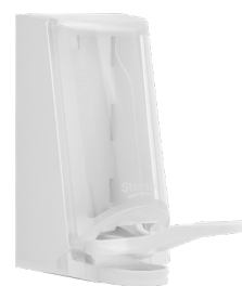
Art nr 4547