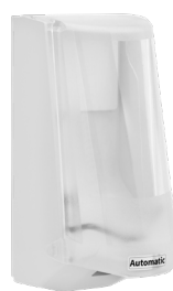
Art nr 4546