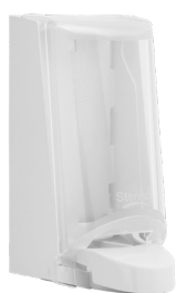
Art nr 4551