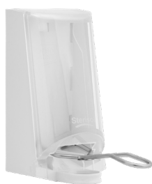
Art nr 4567