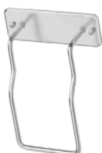
Art. nr. 4573 Sängfäste av metall. Passar alla Sterisol dispensrar 0,7 l.